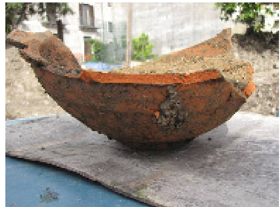
Figura 5. Tomba 1 e corredo

La sepoltura si imposta sui livelli di obliterazione di una struttura insediativa precedente di cui si conservano il pavimento in coccio pesto e due strutture murarie (f.6).