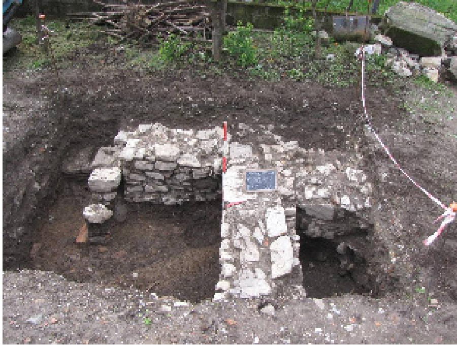
Figura 4. strutture presenti nel saggio2

Saggio 3. I suoi limiti coincidono su tre lati con strutture murarie costituite da pietre di medie e piccole dimensioni intercalate da rade tegole poste in piano che conservano per una altezza considerevole. L'ambiente risultava riempito da alcuni strati di pietrame di grosse dimensioni e malta in tritume che coprivano una sepoltura tardo antica che a sua volta si impostava sui livelli di abbandono di un ambiente di età imperiale.