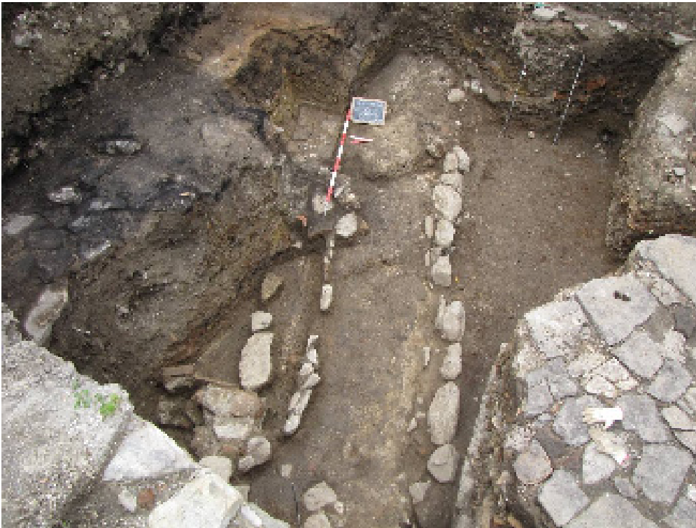
Figura 3. percorso stradale

terreno. Il tracciato ha conservato alcuni gradini (f.3).