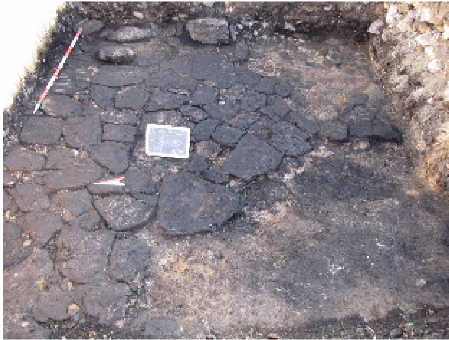
Figura 1. basolato saggio 1

Il pavimento, spoliato in più punti, copriva alcuni livelli argillosi rimescolati ad abbondanti frammenti laterizi e abbondantissimi frammenti di bronzo, forse i resti della distruzione di una area dove si rifondevano i bronzi di epoca precedente (f.2).