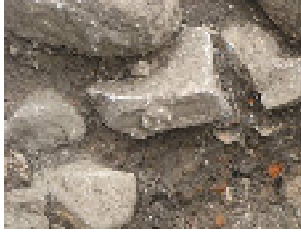
Figura 7. il blocco decorato al momento del rinvenimento.